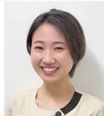
徳山 千沙乃 大塚歯科第3ビル診療所